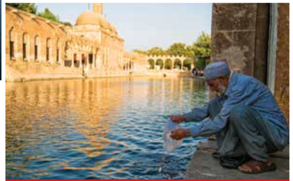
Halil ür-Rahman Gölü (Balıklıgöl)