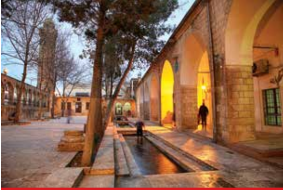
Hasan Padişah Camii