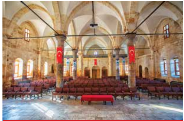
Reji Kilisesi (Aziz Petrus ve Aziz Paolos)