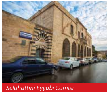
Selahattini Eyyubi Camisi