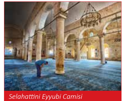
Selahattini Eyyubi Camisi