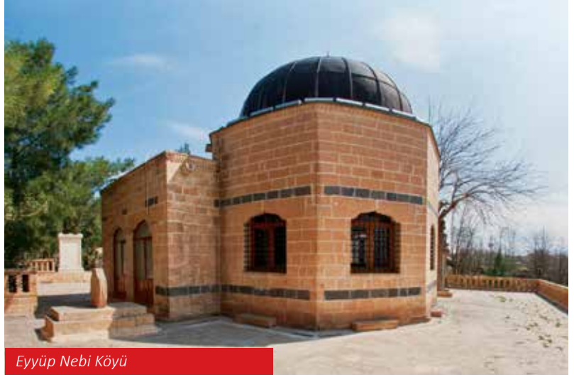
Eyyüb Nebi Köyü

Harran'ın 27 km. doğusunda, Geç Roma Döneminden kalma antik kent kalıntıları ve yer altındaki mağaralar ağı ile örülü bir yerleşim yeri bulunmaktadır. Hız. İbrahim'in soyundan geldiği rivayet edilen Şuayip Peygamber'in burada yer alan mağaralardan birinde yaşadığına inanılmaktadır. Oldukça geniş bir alana yayılmış olan ve etrafı surlarla çevrili bu antik kent, içerisinde çok