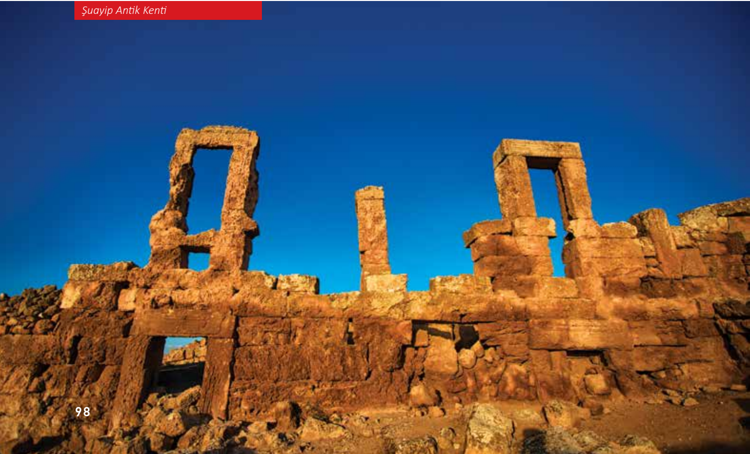
Şuayip Antik Kenti

yer almaktadır. Eski Ahit'teki bilgilere göre; kardeşinin adavetinden kaçan Hız. Yakup, dayısı Laban'ın kaldığı Harran'a gelmiştir. Burada bir kuyunun başında çobanlarla sohbet ederken dayısının kızı Rahel'i görmüş ve ona aşık olmuş, Rahel ile evlenebilmek için 14 yıl dayısının yanında kalarak ücret almadan çalışmıştır.