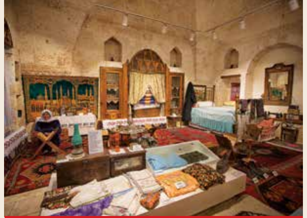
Urfa Kent Müzesi

hayat hikâyesini konu alan Aşil Mozaïği ve M.S. 194 yılına tarihlendirilen Orpheus Mozaïği yoğun ilgi görmektedir. Müze yakınlarında Roma Dönemine ait bir hamam kalıntısı da görülebilmektedir.