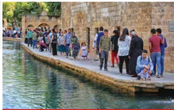
Halil ür-Rahman Gölü (Balıklıgöl)