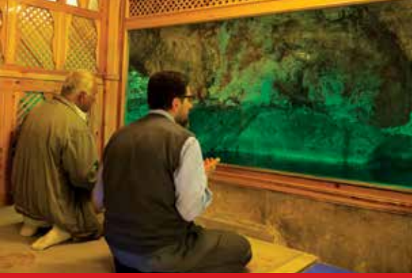
Mevlidi Halil Mağarası