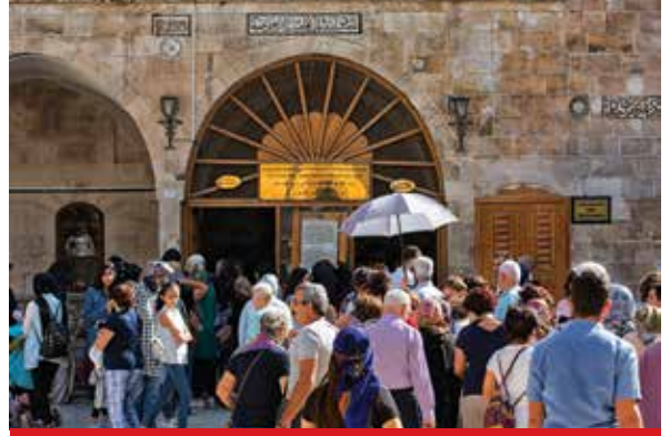
Mevlidi Halil Mağarası