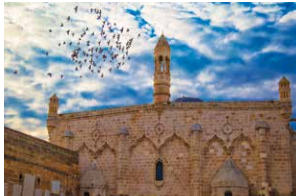
İyad Bin Ganem Camii