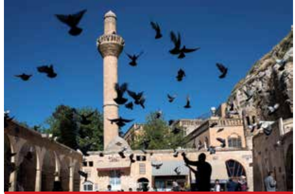
Dergah (Mevlid-i Halil) Camii