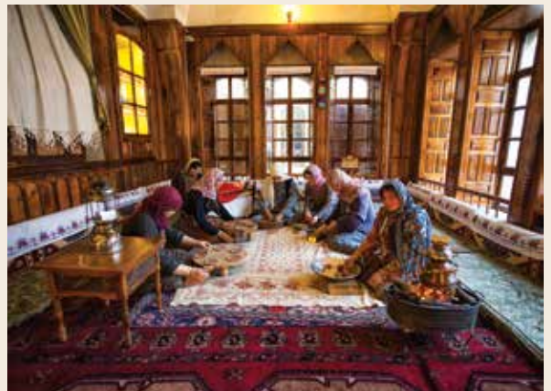
Urfa Mutfak Müzesi