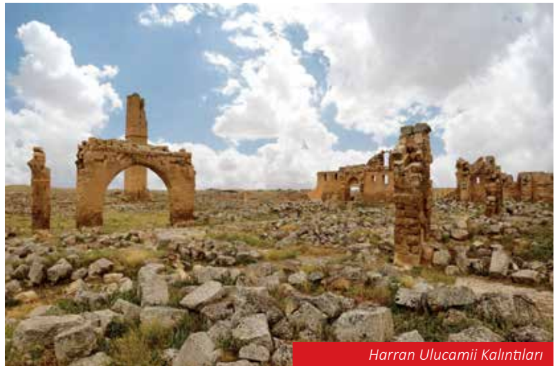
Harran Ulu Camii Kalıntıları

Balıkölü yakınlarında bulunan cami, 15. yüzyılın ikinci yarısında Akkoyunlu Hükümdarı Uzun Hasan tarafından yaptırılmıştır. Balıklıölü'den gelen su, bu caminin avlusundan geçmektedir. Cami, Evliya Çelebi Seyahatnamesinde "Sultan Hasan Camii" olarak geçmektedir. Caminin kuzeyinde özgün mimarisiyle tek şerefeli bir minare yer almaktadır.