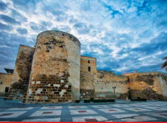
Urfa Kent Müzesi