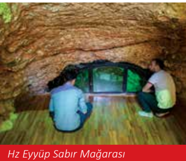
Hz Eyyüp Sabir Mağarası

Bizans döneminde yaşamış olan Piskopos Nona, 460 yılında bu kuyu suyunun cüzzam, fil ve gut hastalıklarını iyileştirdiğini keşfince, buraya bir hastane ve hamam yaptırmıştır. Yine Bizans döneminde buraya inşa edilen Şifacı Azizler Kosması ve Damian Manastırları'nda kuyunun şifalı sularıyla hastaların tedavi edildiği bilinmektedir. 1144 yılında Urfa'yı Haçlı işgalinden kurtaran Musul Hükümdarı İmadeddin Zengi'nin, Hz. Eyyüp kuyusundan çıkarılan su ile romatizmalı ayaklarını yıkayarak şifa bulunduğu yazılı kaynaklarda aktarılmaktadır.